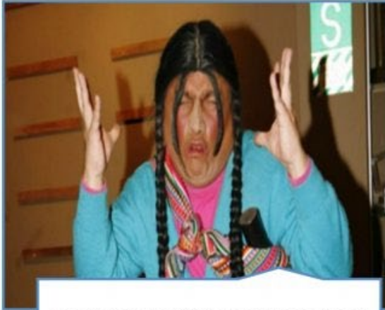
Imagen no realista y deteriorada de la mujer andina