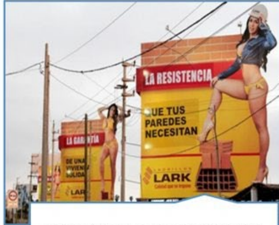
Utilización de la imagen femenina como objeto sexualizado