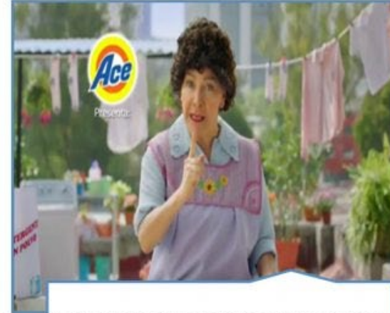
La mujer como la única responsable de los trabajos domésticos

¿Qué imagen de mujer y hombre legitima la publicidad?