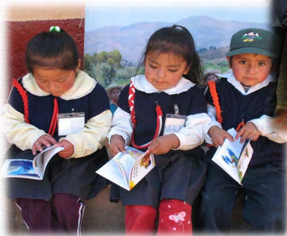
Niños y niñas