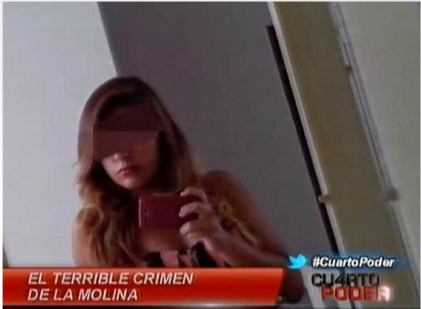
EL TERRIBLE CRIMEN DE LA MOLINA @Cuarto_Poder 15_05: Cómo pueden terminar con la vida del regalo más lindo